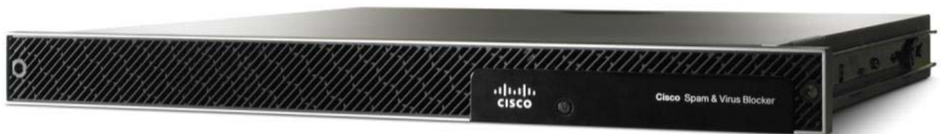
Figure 1. Cisco Spam & Virus Blocker